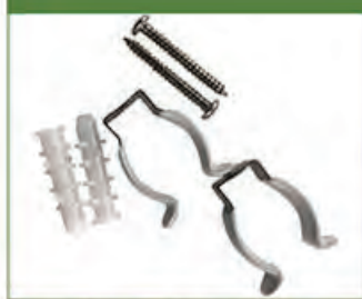
Clips de seguridad con cubierta de goma (1 par) (315-A-0004)