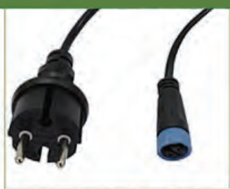
Cable de alimentación 2m Europeo 2x0,75mm 2 + 2 pines (315-A-0002)