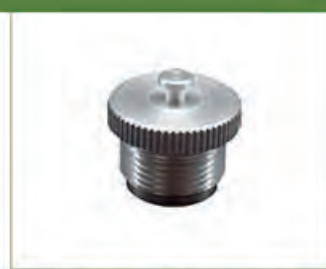
Tapón para enganche de luminarias (315-A-0005)