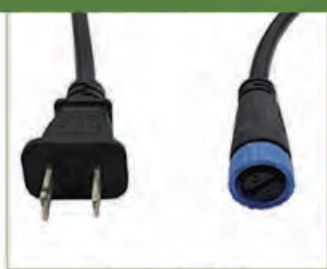
Cable de alimentación 78,78" Americano 2x118AWG + 2 pines (315-A-0003)